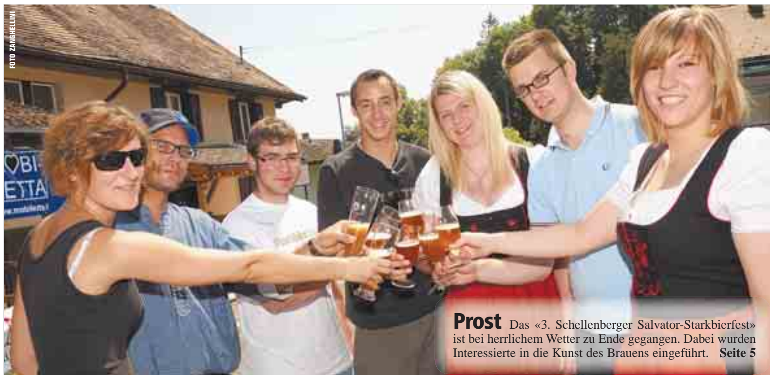
Prost Das «3. Schellenberger Salvator-Starkbierfest» ist bei herrlichem Wetter zu Ende gegangen. Dabei wurden Interessierte in die Kunst des Brauens eingeführt. Seite 5

Ein besonderer Höhepunkt für die Liechtensteinischen Feuerwehren mit ihren über 600 Mitgliedern und deren zahlreichen Verwandten und Freunden war im vergangenen Jahr sicher auch der 100. Landesfeuerwehrtag. Aber auch in diesem Jahr gibt es wieder etwas zu feiern – am 19. und 20. Juni wartet neben der Vorstellung einer neuen Motorspritze und einem Motorspritzen-Wettkampf ein buntes Festprogramm auf die Besucher in Ruggell.