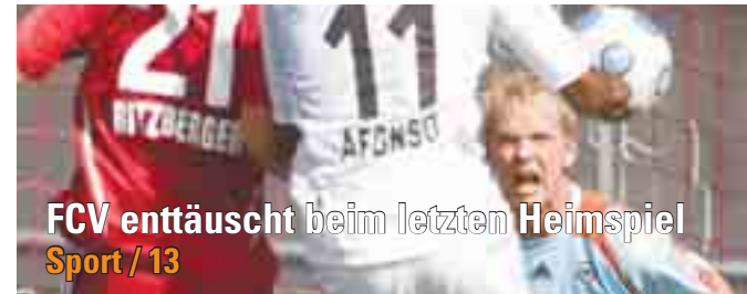
FCV enttäuscht beim letzten Heimspiel Sport / 13